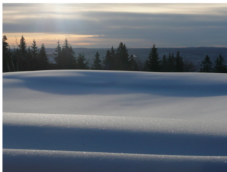
Voksenåsen i sne