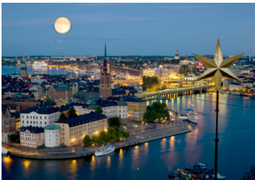
Stockholm i måneskin